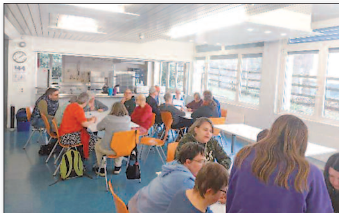
Es wird geknabelt und gerätselt