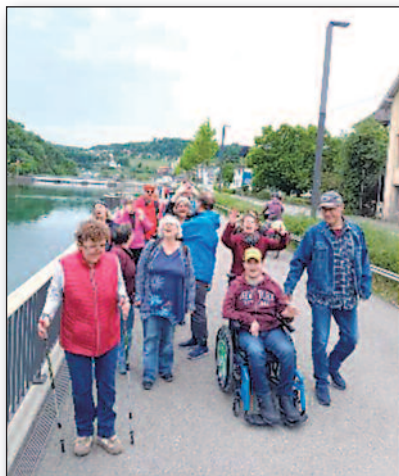
Spaziergang und Pizzaessen

Im Jahr 2025 hatten wir ein tolles Programm: