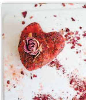
Eine Geschichte über Rosen und dann stellten wir Seife her