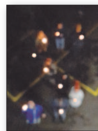
L und S bei Tag und Nacht

Auch in diesem Jahr musste das Sommerfest wetterbedingt drinnen stattfinden: Es gab diesmal Chips, Hotdogs, für die Vitamine Gurken, Tomaten und Radiesli. Und beim Büchsenwerfen konnte man einzelne Buchstaben abschiessen. Aber es blieb auch Zeit für Gespräche und Musik, abwechslungsweise aus verschiedenen Handys.