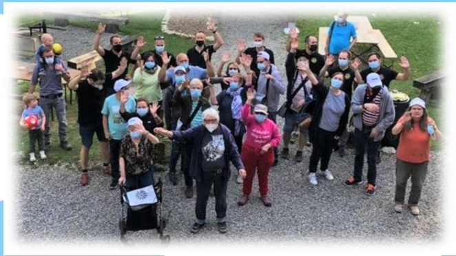
Spielnachmittag im Buchberghaus