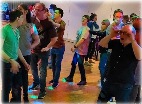
Disco im Tanzzentrum Tonwerk