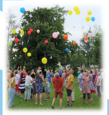
Inseltreff - 20 Jahre Jubiläum